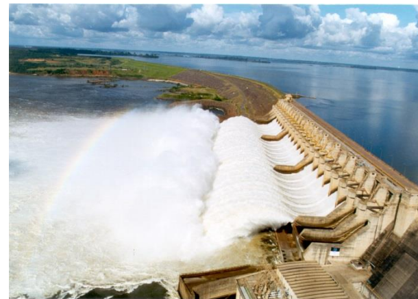
Usina Hidrelétrica de Tucuruí (PA).

O nível 3 considera que, até 2050, será implementado todo o potencial hidrelétrico inventariado. Assim, a potência instalada chega a 172 GW, com usinas hidrelétricas (UHEs) e pequenas centrais hidrelétricas (PCHs) (EPE, 2016) 2 . Esse potencial corresponde à parcela com maior confiabilidade técnica.