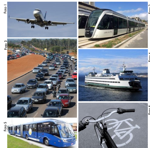
Foto 1: Pixabay | CC0 1.0; Foto 2: VLT. Foto de Mariordo | CC BY-SA 4.0; Foto 3: Adaptado de Fabio Rodrigues Pozzebom/ABr | CC BY 3.0 BR; Foto 4: Pixabay | CC0 1.0; Foto 5: BRT. Foto de Luiznp | CC BY-SA 3.0; Foto 6: Pixabay | CC0 1.0.

O nível 3 assume a manutenção dos modais aeroviário, ferroviário e aquaviário nos mesmos patamares do nível 2, e considera mudanças em infraestrutura de mobilidade urbana que priorizem o transporte não motorizado, em detrimento do transporte rodoviário individual.